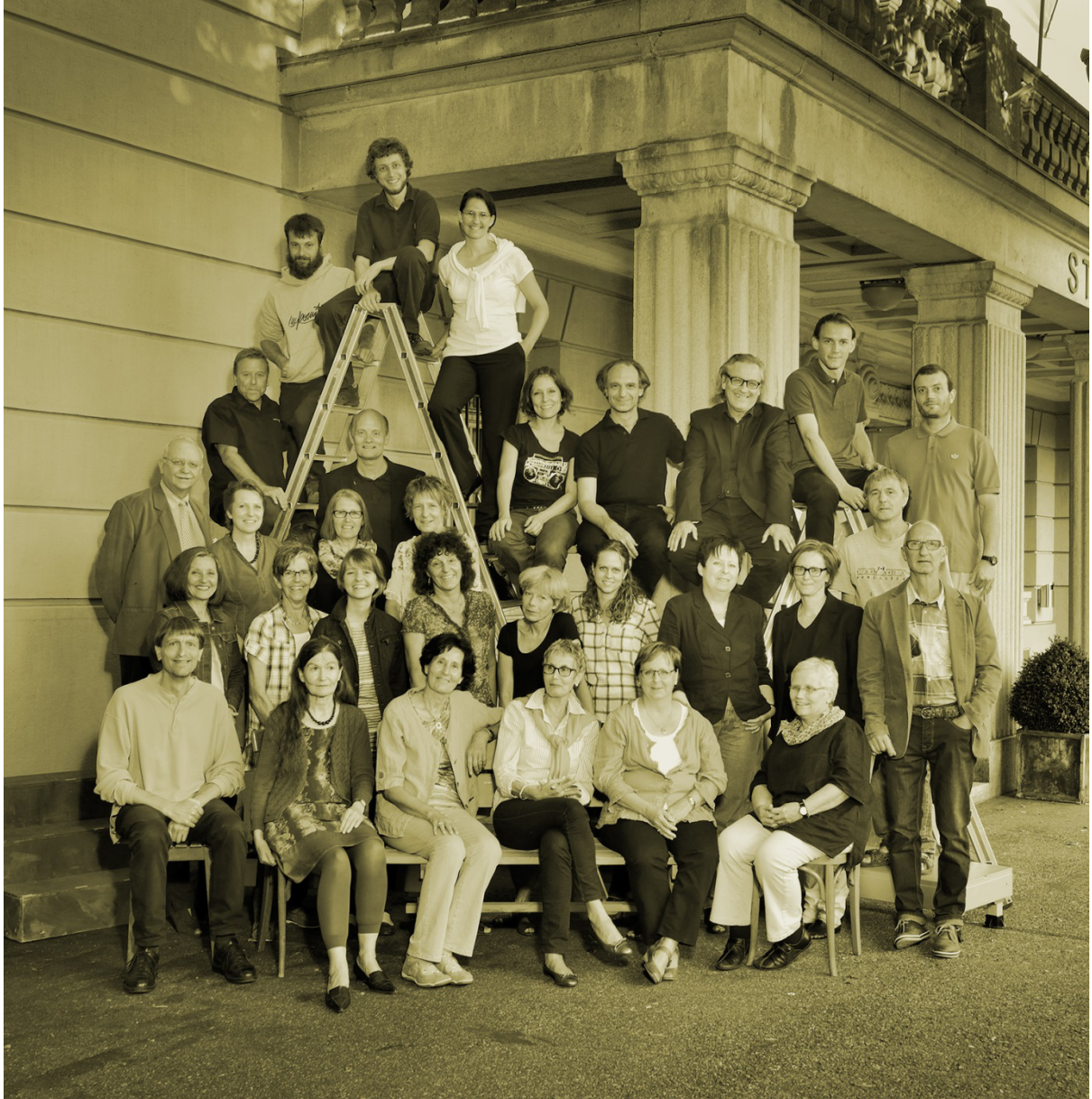
Mitglieder der Theaterkommission / Angestellte Stadttheater / Mitarbeiter nebenamtlich