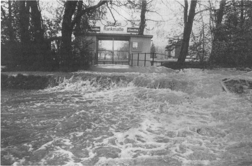
Langetenüberschwemmung in der Rankmatte (23. Oktober 1985).