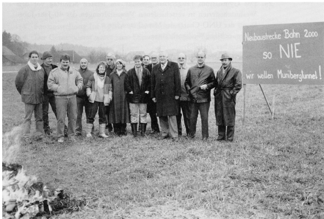
Das Aktionskomitee «Bahn 2000 für Munibergtunnel» mit Behördevertretern von Langenthal und Thunstetten auf dem Wolfhusenfeld.