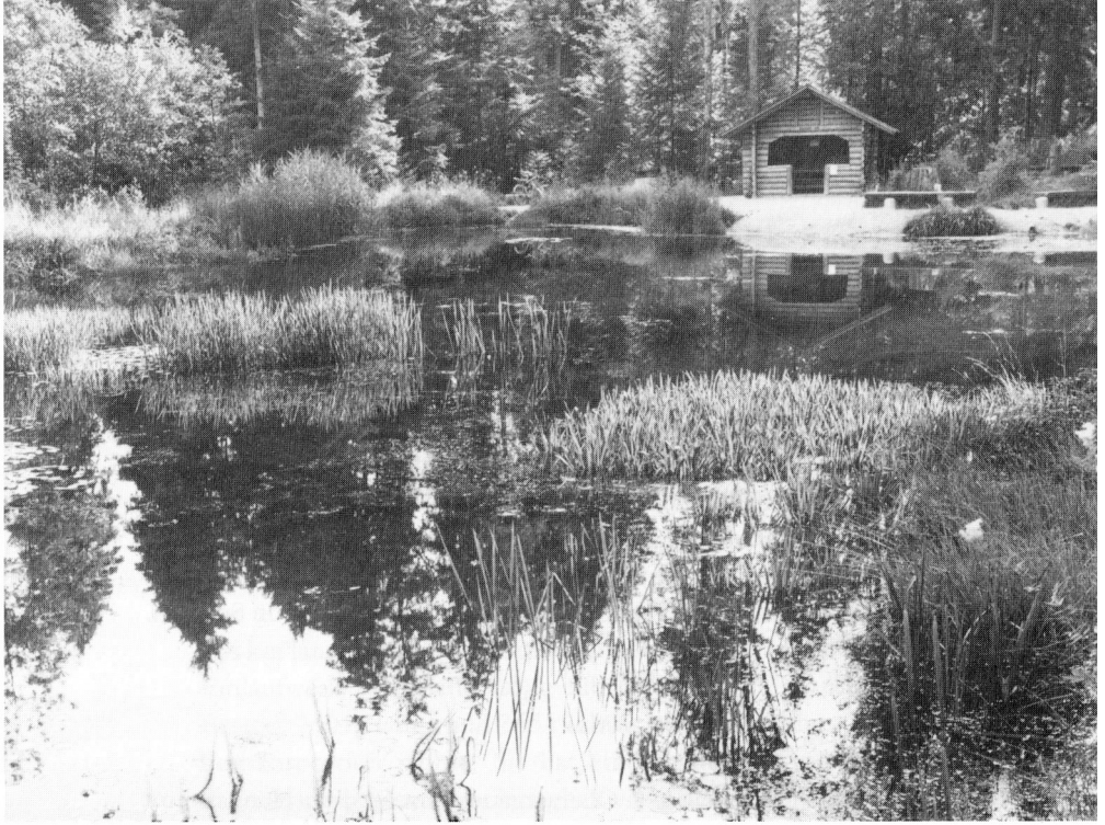
Der Aspisee.

35 Jahren Gemeindedienst 2100 Trauungen vorgenommen, 13 700 Geburten und 5700 Todesfälle registriert.