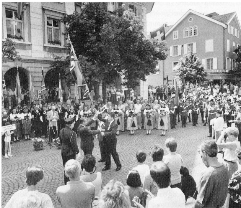
Kantonalbernisches Musikfest 1989. Fahnenübergabe vor dem Gemeindehaus.