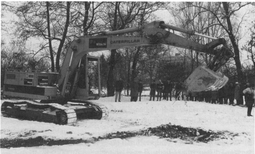
An der gleichen Stelle der erste «Spatenstich» für das grosse Werk Hochwasserschutz unteres Langental (7. Januar 1987).