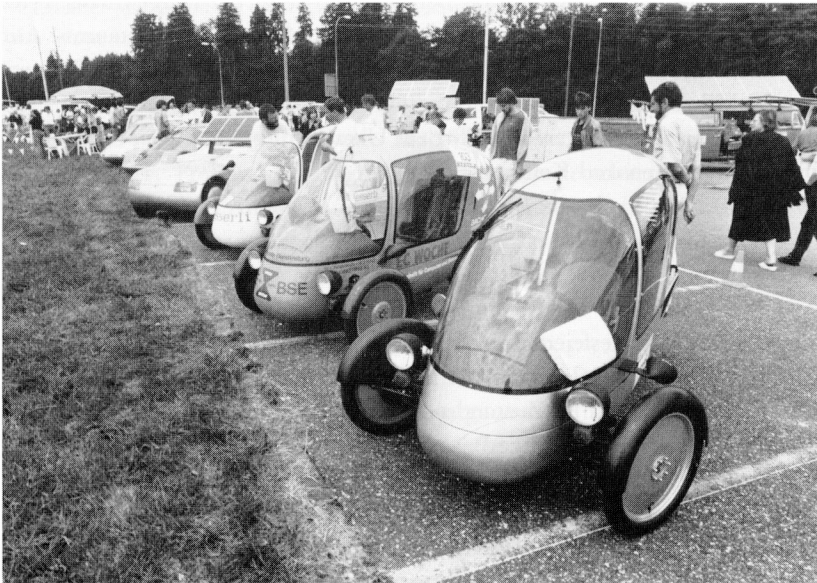
Solarmobile der Tour de Sol am Etappenziel auf dem Greiner Areal.