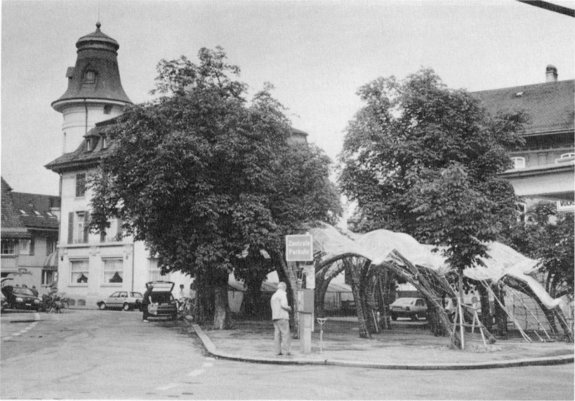
Die «Wydewelke» auf dem Wuhrplatz 1988.