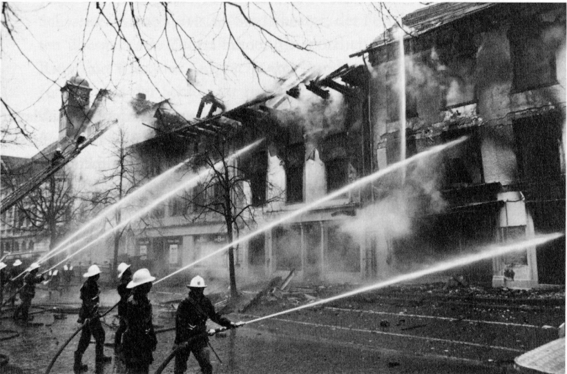
Der Grossbrand an der Marktasse im April 1983.