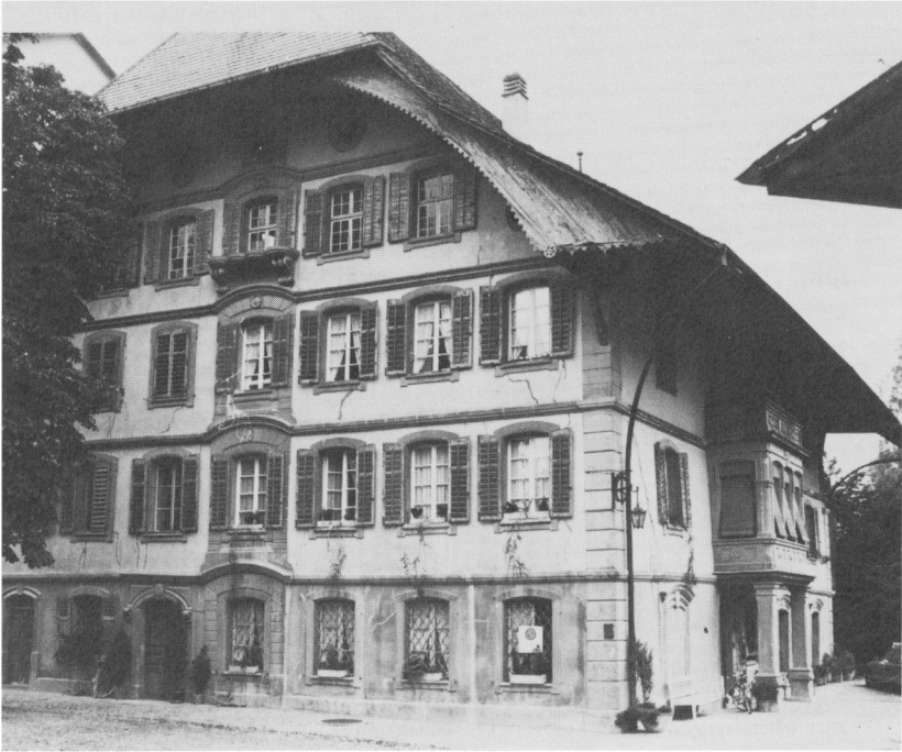
Die Mühle, seit 1982 in der Hand einer Stiftung, vorgesehen als Mittelpunkt öffentlichen und kulturellen Lebens.