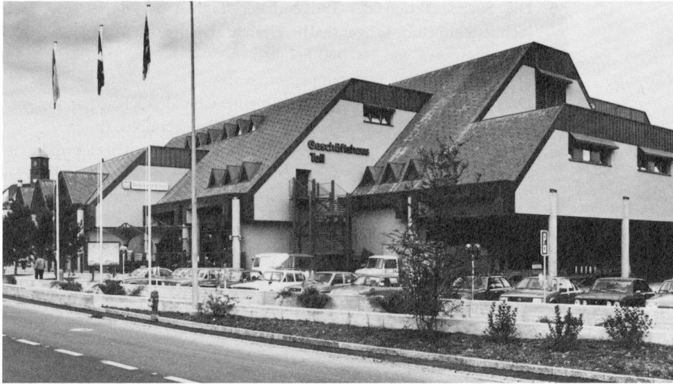
Das neue Geschäftshaus Coop-Center Tell.