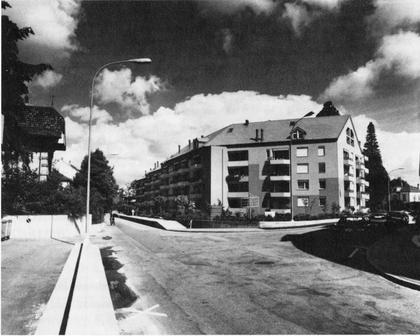
Überbauung untere Bahnhofstrasse.