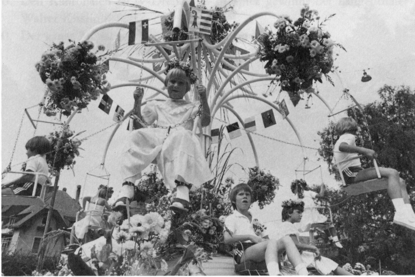
Regionale Garten- und Blumenschau 1984. Abschliessender Blumenkorso.