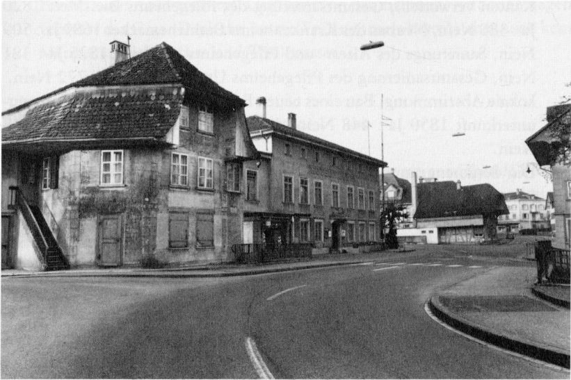
Drei Gebäude, die nicht mehr (links Pulverhüsl, rechts im Hintergrund Biglerhaus) oder nicht mehr in dieser Gestalt (in der Mitte der «Löwen») bestehen.