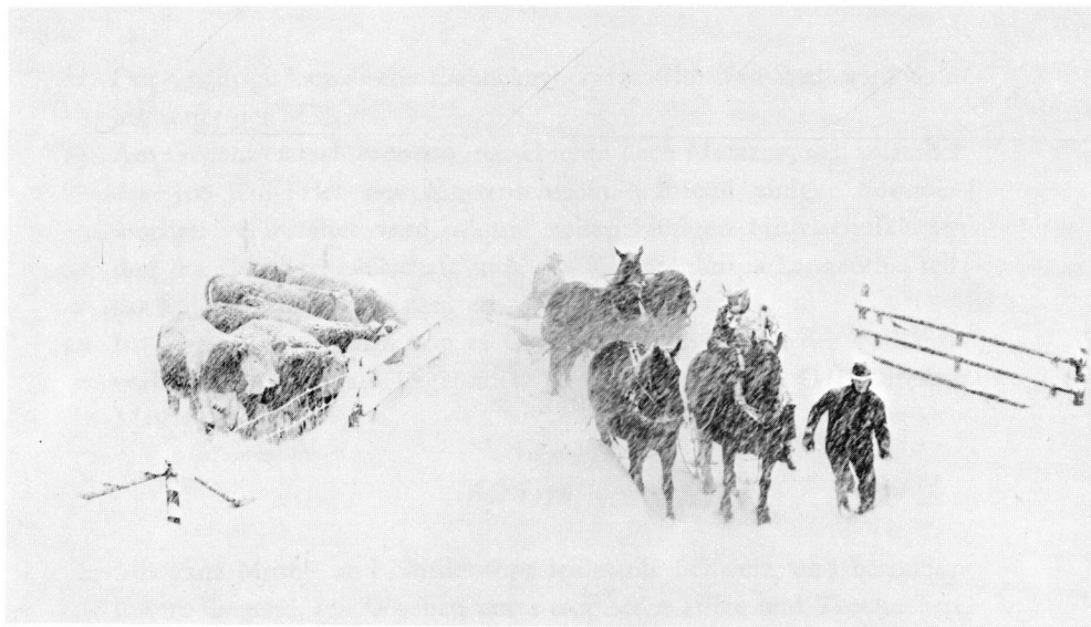
Der grosse Schnee Januar 1977