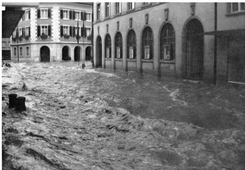
Der grosse Regen Das Langete-Hochwasser vom 30. August 1975 (Gemeindehaus und Bahnhofstrasse 5 Uhr morgens)