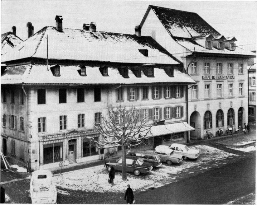
Das Walser-Kuert-Haus während des Abbruchs