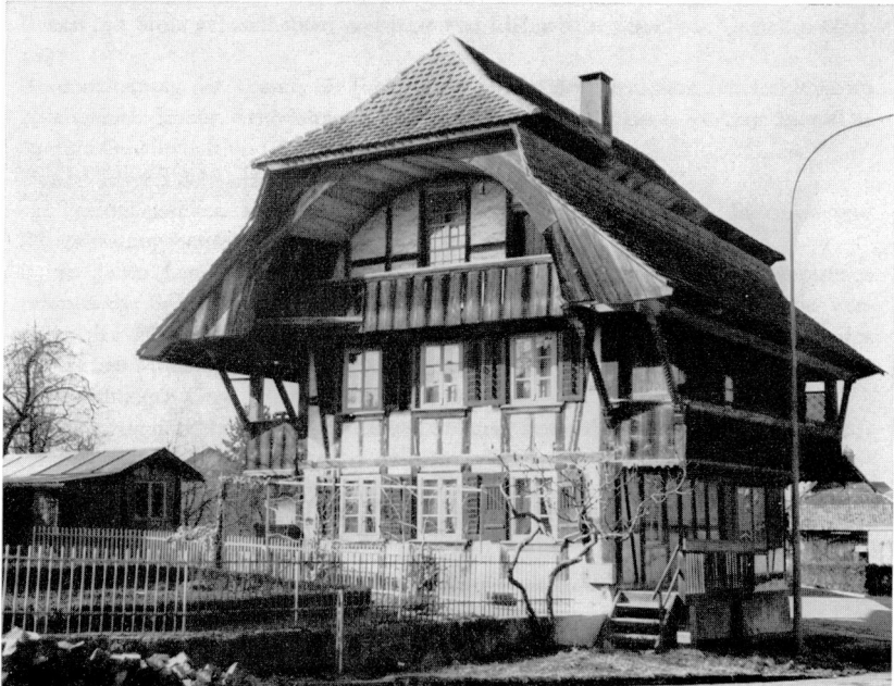
▼ Aufnahme Hans Zaugg

Der ebenfalls erhalten gebliebene «Giesser-Geiser-Stock»