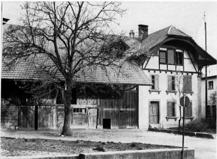
Der Hübelihof zu Beginn des Abbruchs