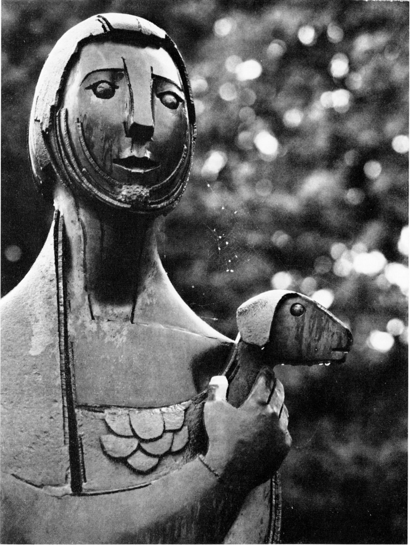
Der gute Hirte Bronzeplastik auf dem Friedhof, von Peter Siebold