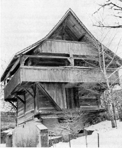
◀ Der gerettete «Allmen-Spycher»

Der ebenfalls erhalten gebliebene «Giesser-Geiser-Stock»