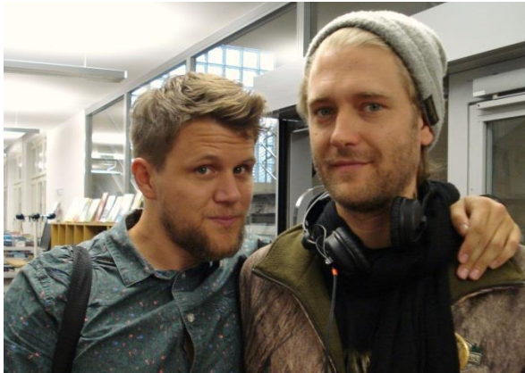
Knackeboul und Chocolococolo